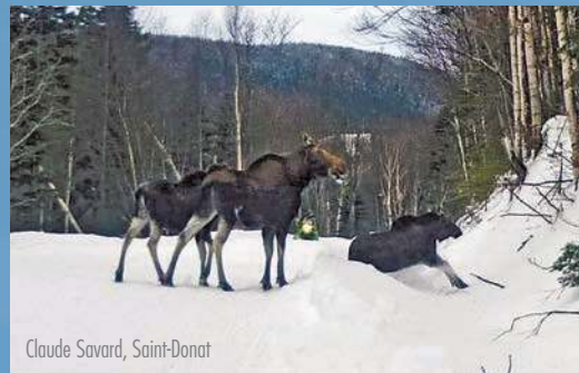
Claude Savard, Saint-Donat